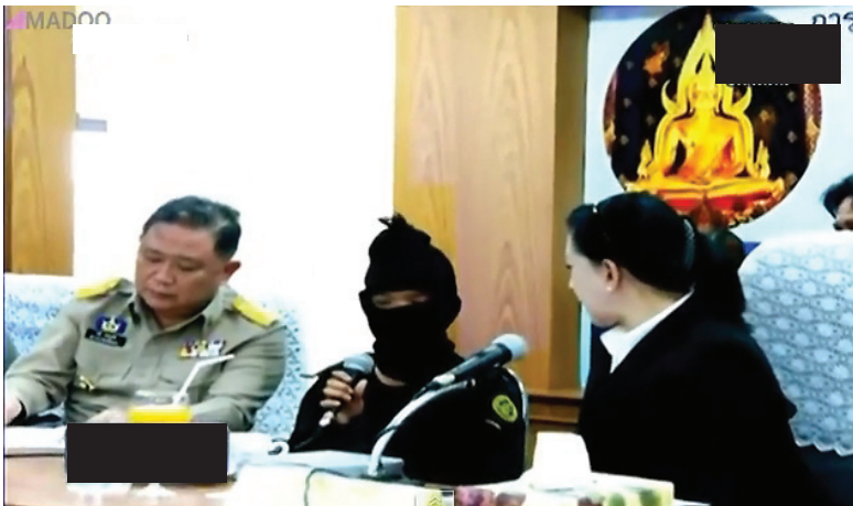
ภาพที่ 1 การนำเด็กอายุต่ำกว่า 18 ปี ซึ่งเป็นพยานในคดีฆาตกรรมมาแถลงข่าว

คดีดังกล่าวมีการจัดแถลงข่าวและนำตัวพยานซึ่งเป็นเด็กอายุไม่เกิน 18 ปีมาร่วมแถลงข่าว ทีมงานให้เด็กสวมหมวกโม่เพื่ออำพรางใบหน้า แต่ภาพ (ซึ่งแสดงรูปพรรณสัณฐาน) ของเด็กถูกเผยแพร่ผ่านสื่อมวลชนทุกแขนง เสียงของเด็กขณะที่ให้สัมภาษณ์ก็ถูกเผยแพร่ออกไปผ่านสื่อโทรทัศน์และถูกเผยแพร่ซ้ำผ่านเว็บไซต์ต่างๆ ย่อมมีโอกาสที่เด็กจะถูกจดจำได้ การกระทำดังกล่าวนอกจากนำมาซึ่งการเปิดเผยตัวตนของเด็กทางอ้อมแล้ว ยังอาจจะนำอันตรายมาสู่ตัวเด็กและครอบครัวได้อีกด้วย