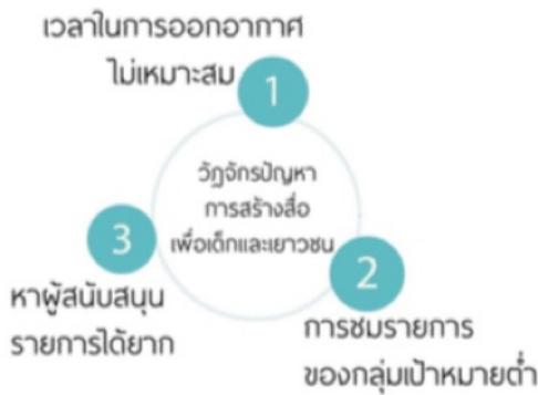
แผนภาพที่ 2 ปัจจัยอุปสรรคของการพัฒนารายการเด็ก

นอกจากนี้จากการศึกษาวิจัยยังพบอีกว่า ปัญหาสำคัญที่เชื่อมโยงกันเป็นอุปสรรคต่อการพัฒนารายการเด็ก มี 3 ส่วน ได้แก่ 1.เวลาในการออกอากาศไม่เหมาะสม 2.การชมรายการของกลุ่มเป้าหมายต่ำ และ 3.หาผู้สนับสนุนรายการได้ยาก